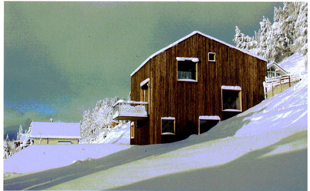
37] Casa Mathis, Trin, Norbert Mathis, 2008, CH Lärchenlatten gebrannt, gebürstet und gewaschen | Burnt larch bars, brushed and water-washed